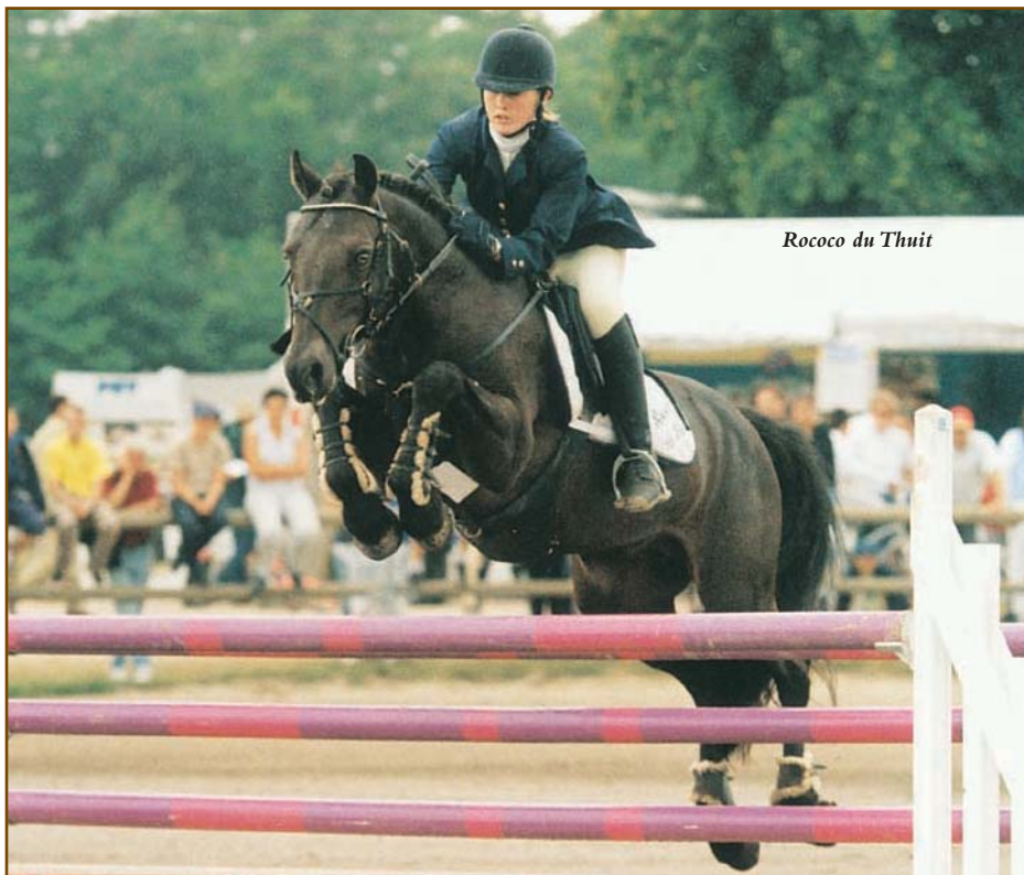
Rococo du Thuit

I.M. : Environ 80 % sont des poneys de sport de race Poney Français de Selle, New Forest et Shetlands, mais nous avons aussi quelques