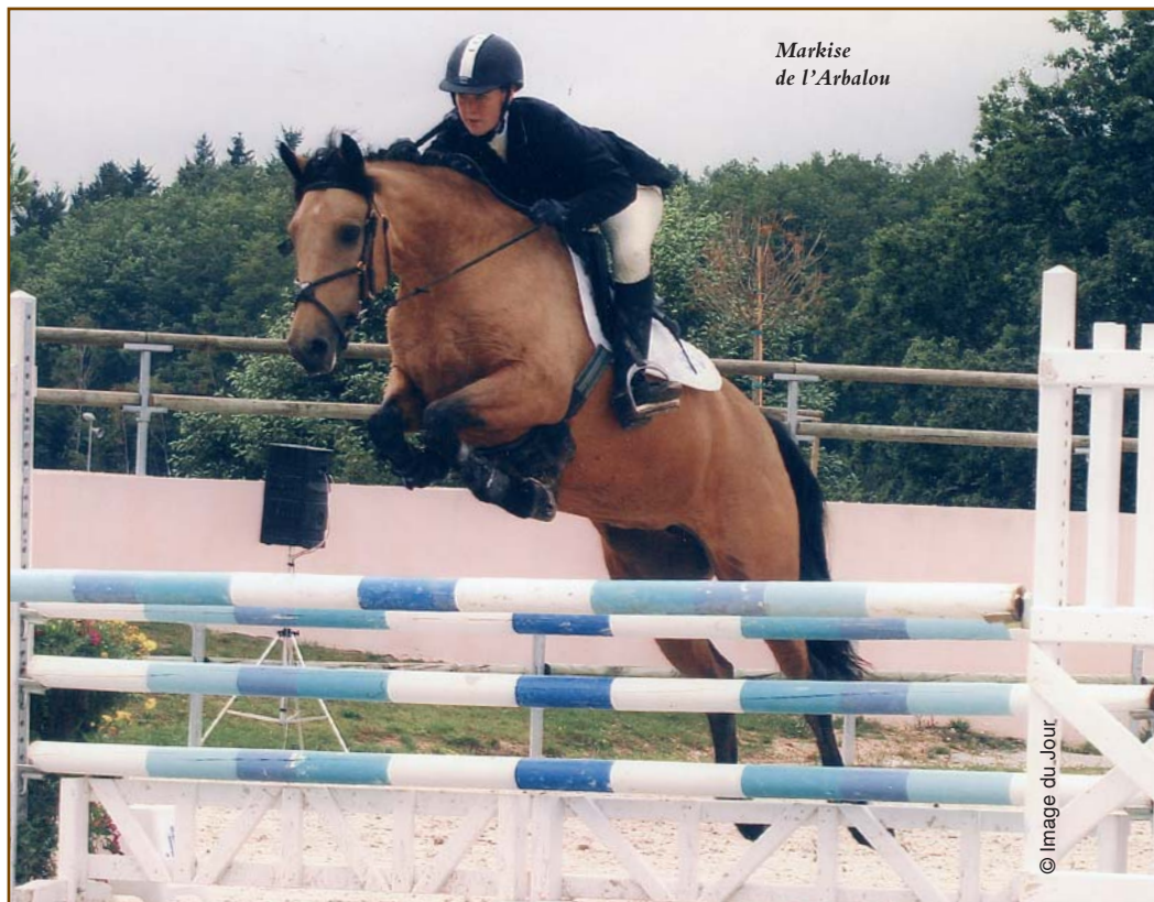
Markise de l'Arbalou