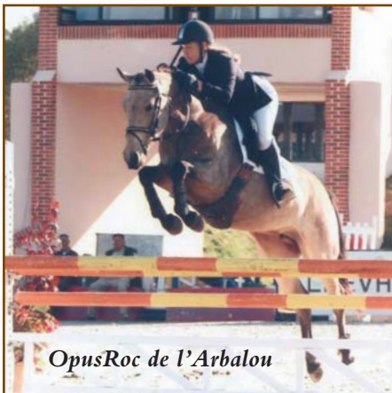
OpusRoc de l'Arbalou

qui a été finaliste aux championnats de France, Grand Prix Elite. Etoile d'Hardy étalon NF qui plus tard a fait les championnats d'Europe dressage. Illoyay Cheriton Fast étalon NF qui après un an de valorisation chez nous a été vendu aux Haras Nationaux.