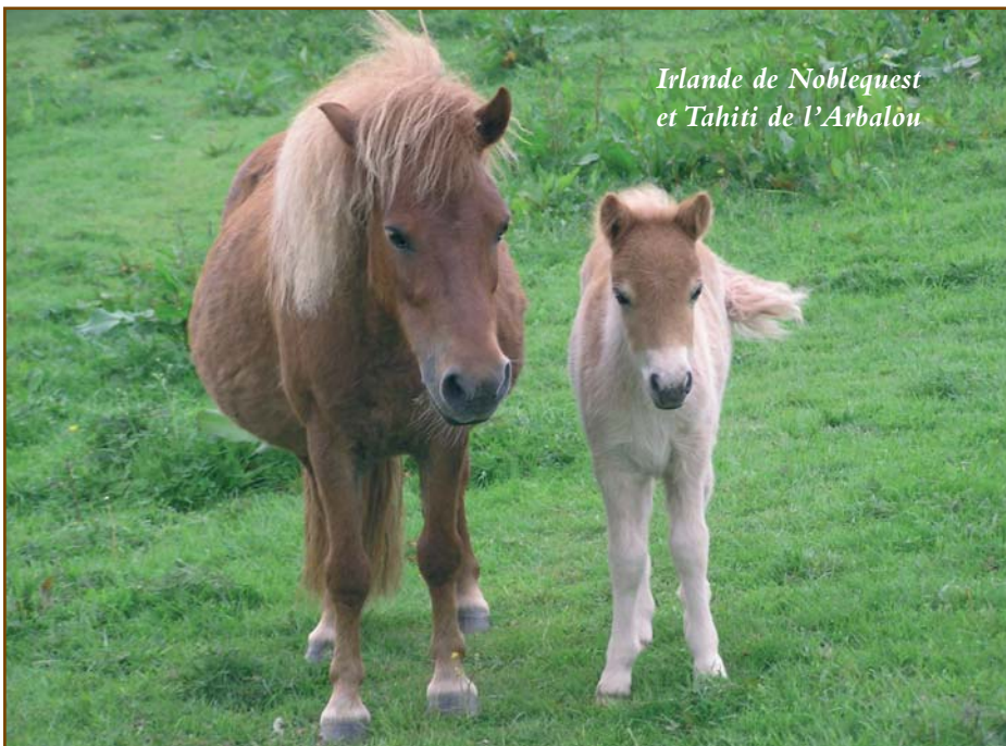
Irlande de Noblequest et Tahiti de l'Arbalou