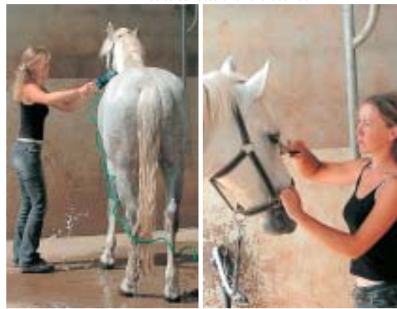
Petite toilette avant la séance...